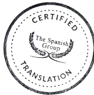
Salvador G. Ordorica The Spanish Group LLC (ATA #267262)

The Spanish Group LLC verifies the credentials and/or competency of its translators and the present certification, as well as any attached pages, serves to affirm that the document(s) enumerated above has/have been translated as accurately as possible from its/their original(s). The Spanish Group LLC does not attest that the original document(s) is/are accurate, legitimate, or has/have not been falsified. Through having accepted the terms and conditions set forth in order to contract The Spanish Group LLC's services, and/or through presenting this certificate, the client releases, waives, discharges and relinquishes the right to present any legal claim(s) against The Spanish Group LLC. Consequently, The Spanish Group LLC cannot be held liable for any loss or damage suffered by the Client(s) or any other party either during, after, or arising from the use of The Spanish Group LLC's services.